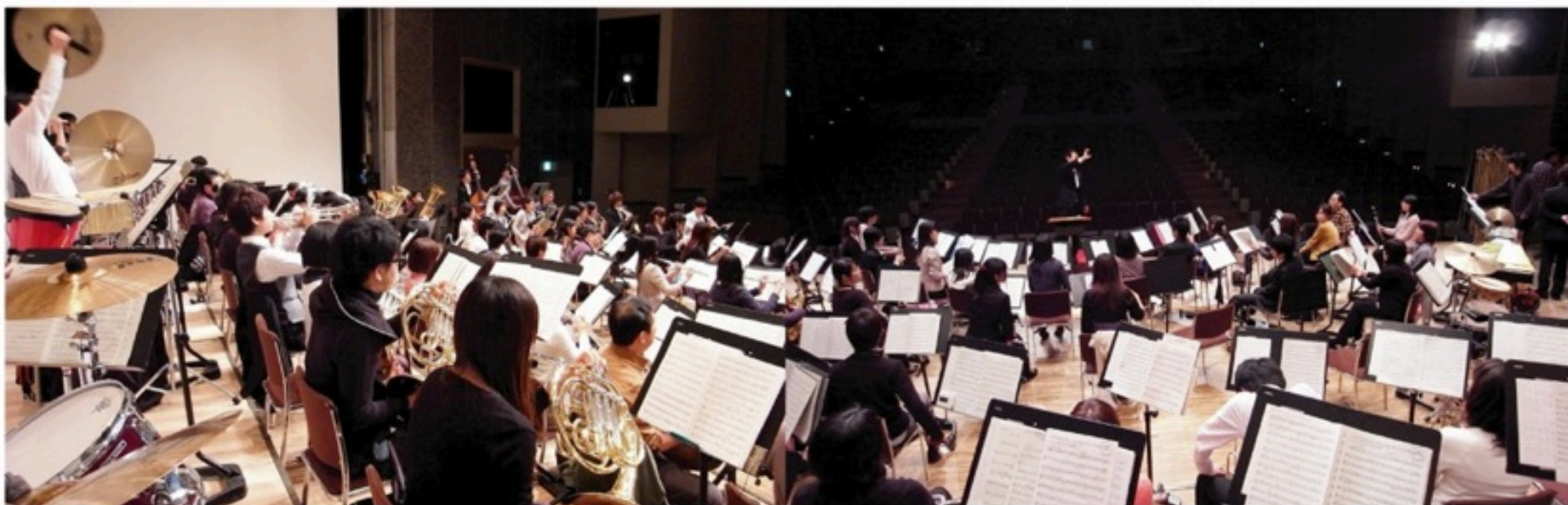
▲安定の町田開催となった第六回定期演奏会。この一ヶ月後に東日本大震災が発生するとは、もちろん誰も知るわけがなく。