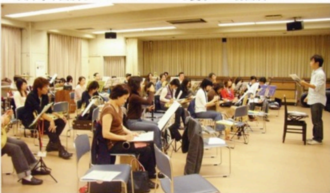
▲練習も一気に人数が増えました。