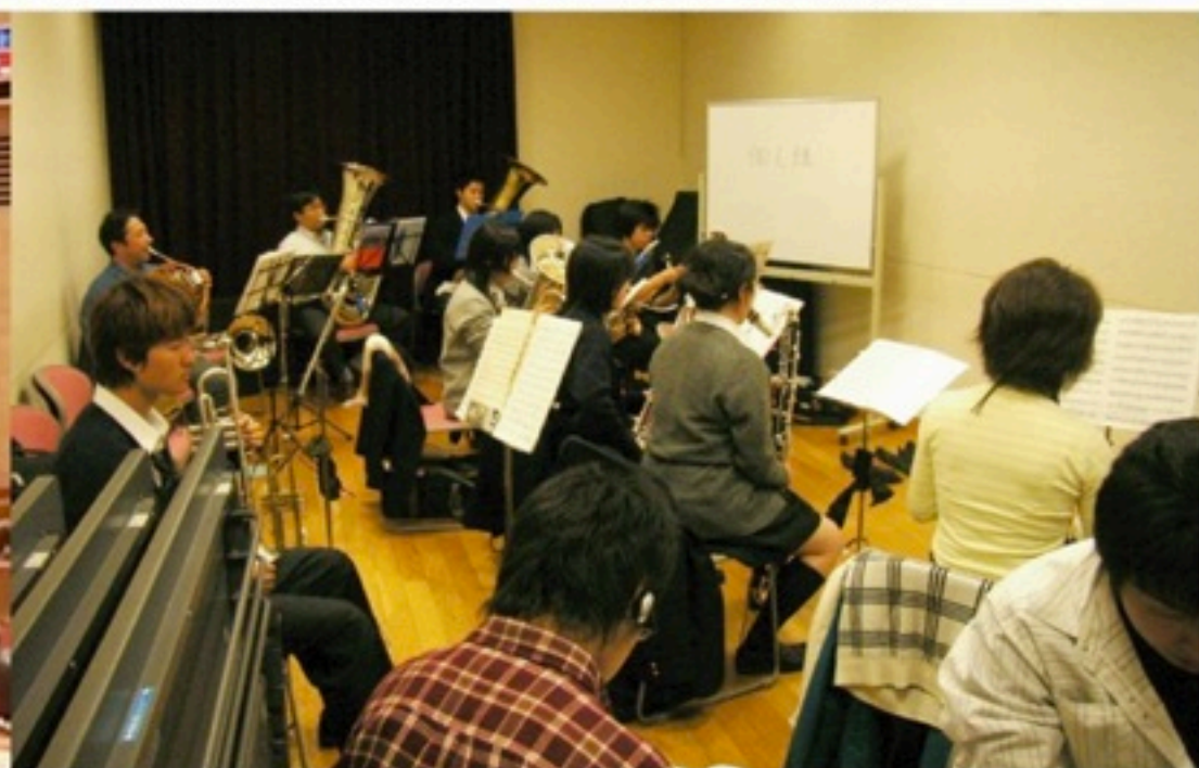
▲本番前最後の練習ですが、こんなに少ない人数だったんです。