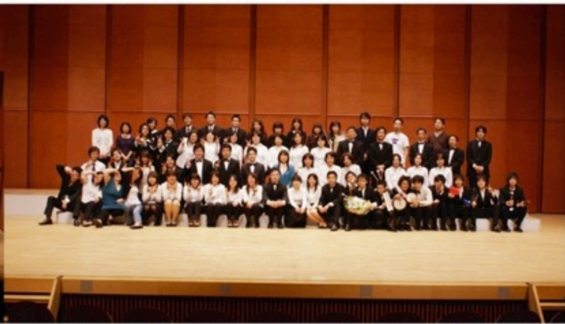
▲演奏会後に記念写真を撮ったのが初めてです。