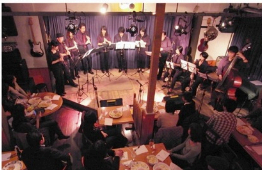
▲クラリネットアンサンブルチーム「クラッツ」活動開始。まさかのワンマンライブやロビーコンサートなどで以降大活躍！