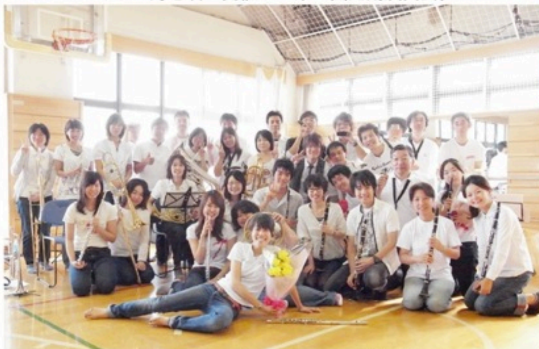
▲今のところファミリーコンサートはこの時が最後です。