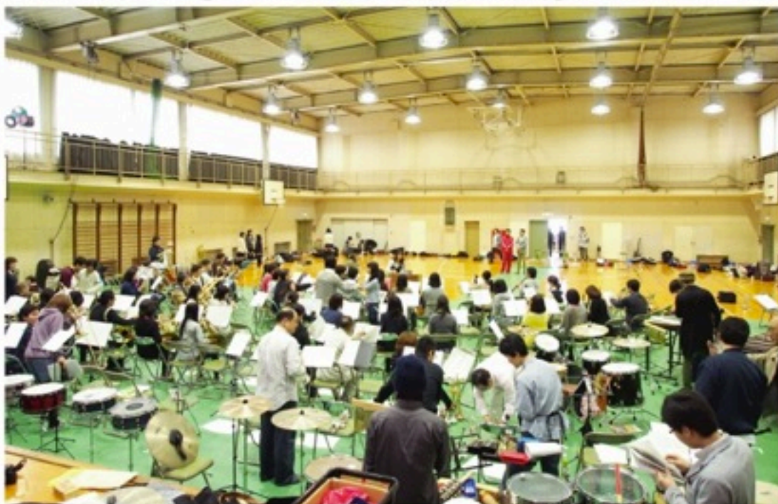
▲「音楽団・町田」さん、「木曾中学校吹奏楽部」さんと共催した『We Love 吹奏楽まちだ』は素敵な経験でした。