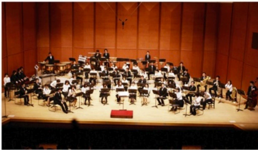
▲定演のない年だったため「春のコンサート」開催。