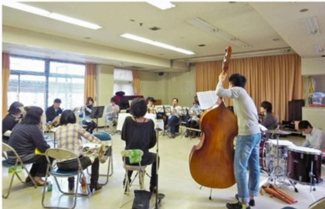
▲計画停電により、昼にしか練習できなかった時期も。