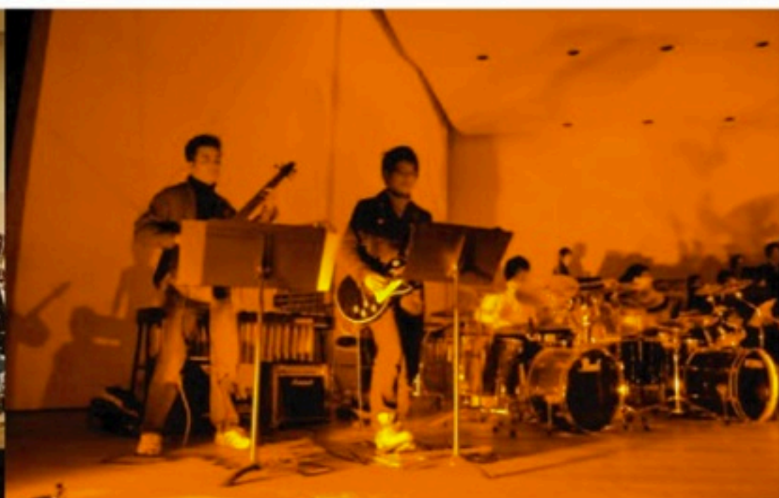
▲ギターにベースにツインドラムという試みも。