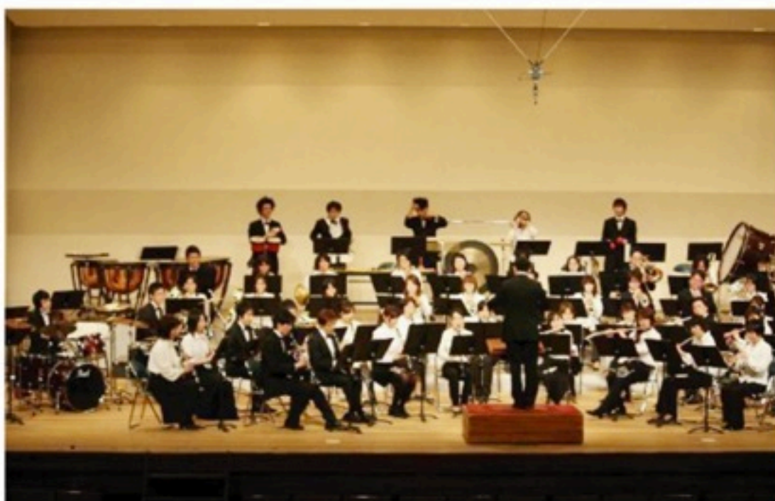
▲いろいろあって海老名で開催した第四回定期演奏会。