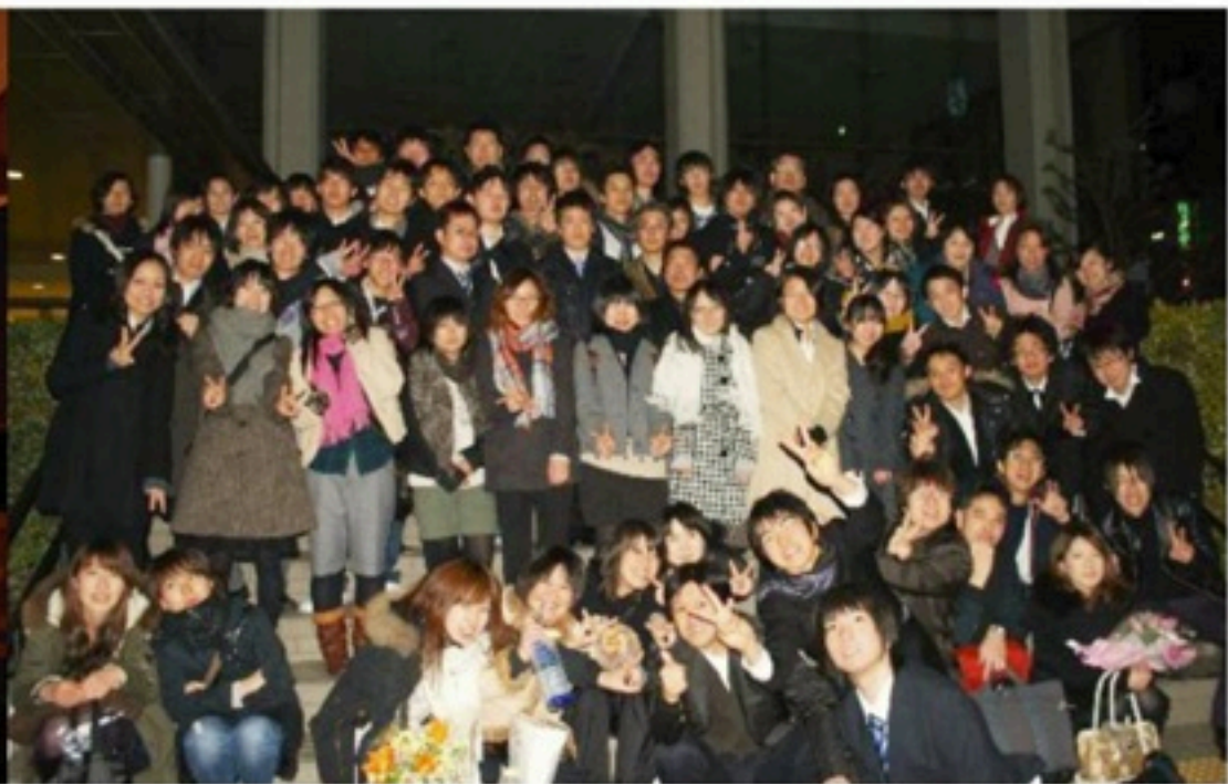
▲久々に町田へ凱旋しての第五回定期演奏会。メインで演奏した「楓葉の舞」は、未だ語り継がれる名曲かつ迷曲…！