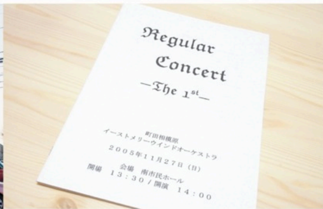
▲記念すべき「第一回定期演奏会」、会場は相模大野の南市民ホール。出演メンバー数は約40名で、現在の半分ほどでした。