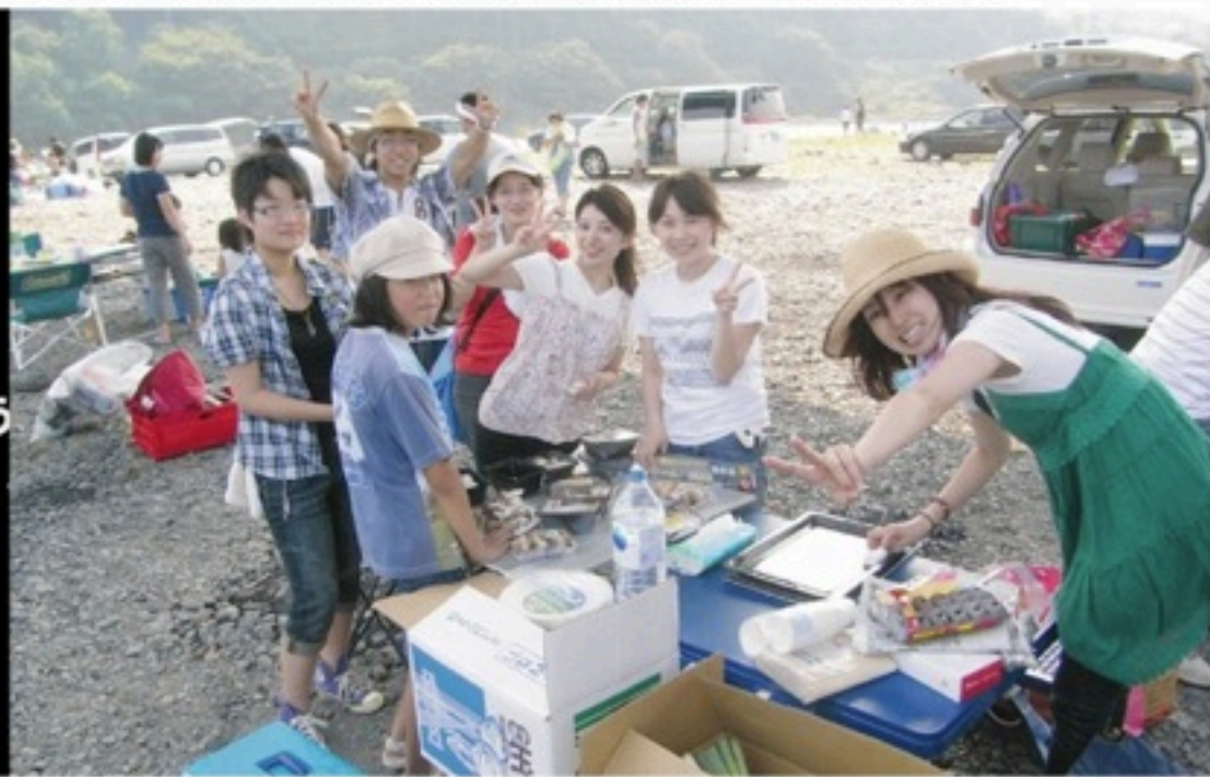
▲夏のBBQなど、団内の親睦も深まってきました。