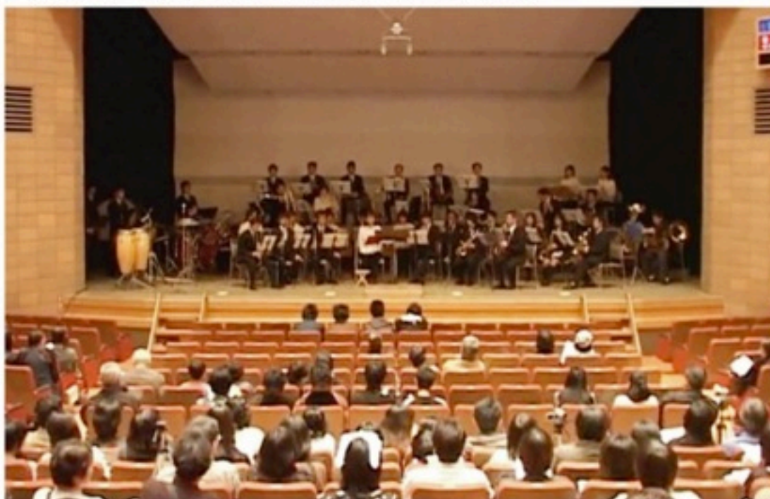
▲当時は客席にいた、という現団員も。