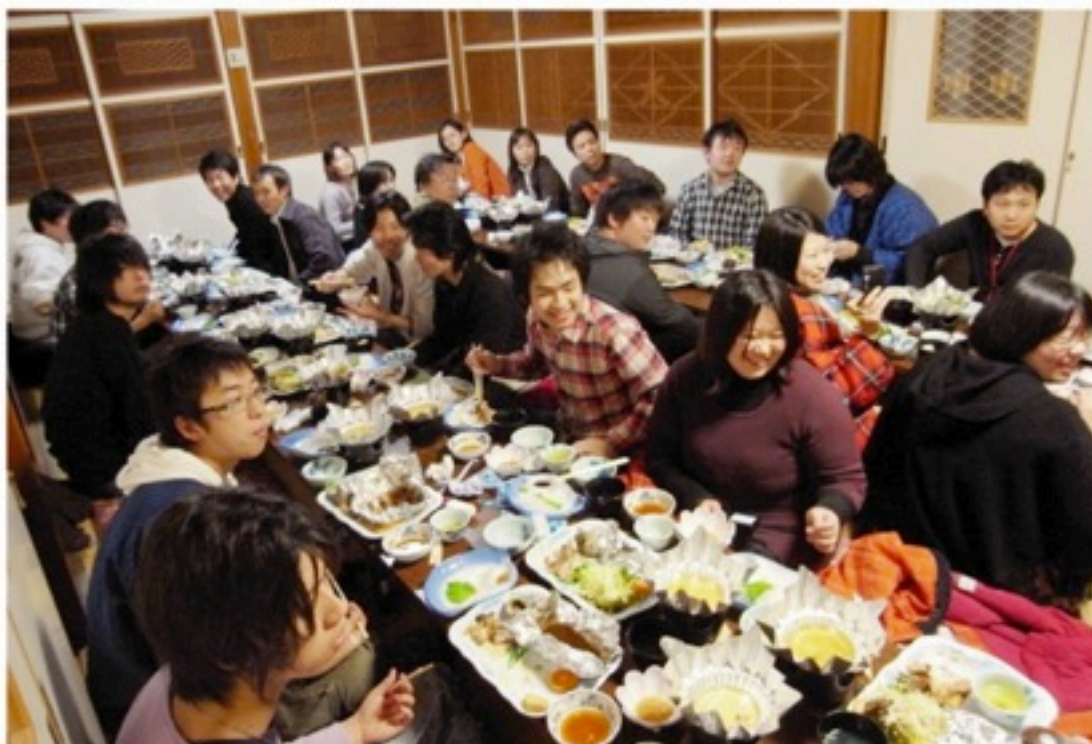
▲年末には南房総にて初の練習合宿を開催！