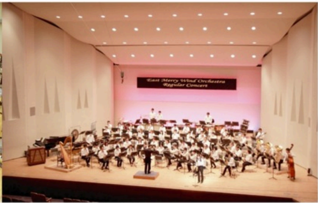
▲二年連続のグリーンホール、3月の「第八回定期演奏会」。ただ、これが終わっても一息はつかえません。なぜなら…??