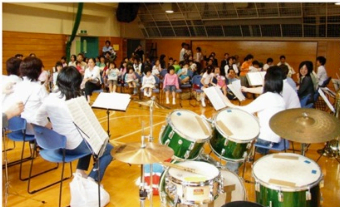
▲当時はファミリーコンサートを毎年開催していました。