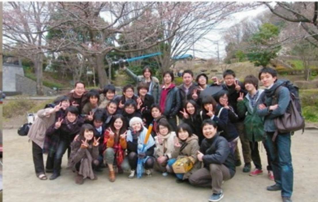
▲景気付けに、花見ならぬ枝見をしました！（ぎりぎり開花前）