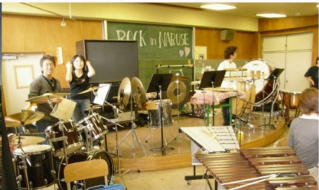
▲創立メンバーの母校、成瀬高校をお借りして練習したことも。