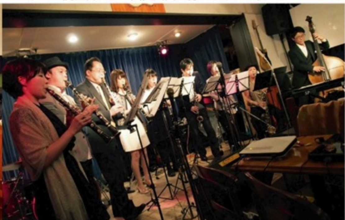
▲団内結婚ラッシュ！ 新郎新婦が出会ったライブハウス（11年に「クラッツ」が使用）で開かれた、イスメリ限定結婚パーティー。