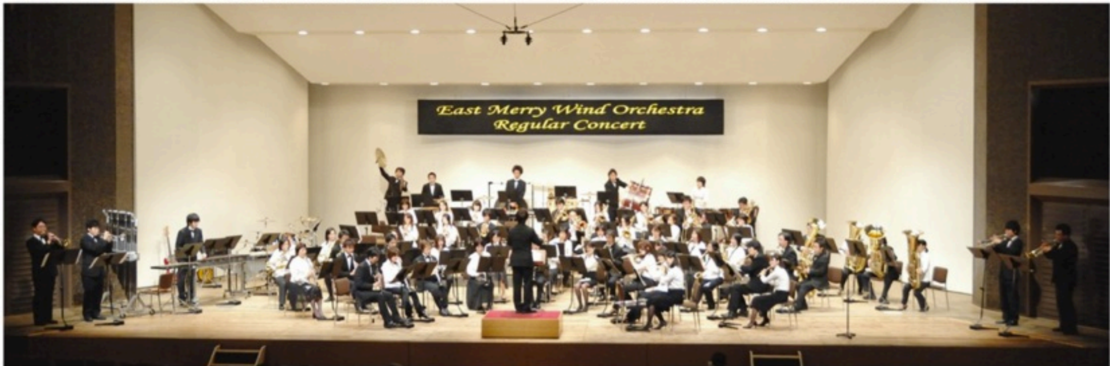
▲順調にメンバーを増やし、最初の到達点となった「第三回定期演奏会」。早くも「イスメリらしさ」が出来上がりました。