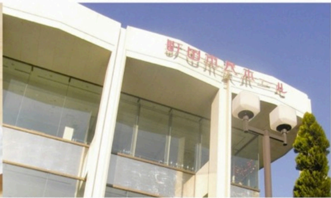
▲念願の大舞台、町田市民ホールでの演奏会開催が実現です。