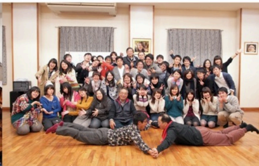
▲第十回へ向けて、練習の日々。なかでも一大イベントは、やはり合宿でしょうか。曲ともメンバーとも仲良くなれるチャンス！