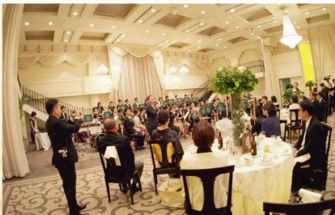
▲団内ご夫婦の結婚披露宴にてイスメリとして演奏させていただくという、ものすごく貴重な経験も！