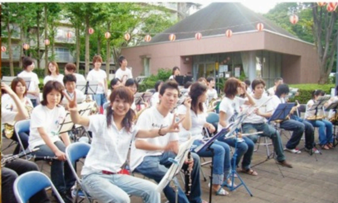
▲以降毎年出演させていただいている夏祭りへ初出演！