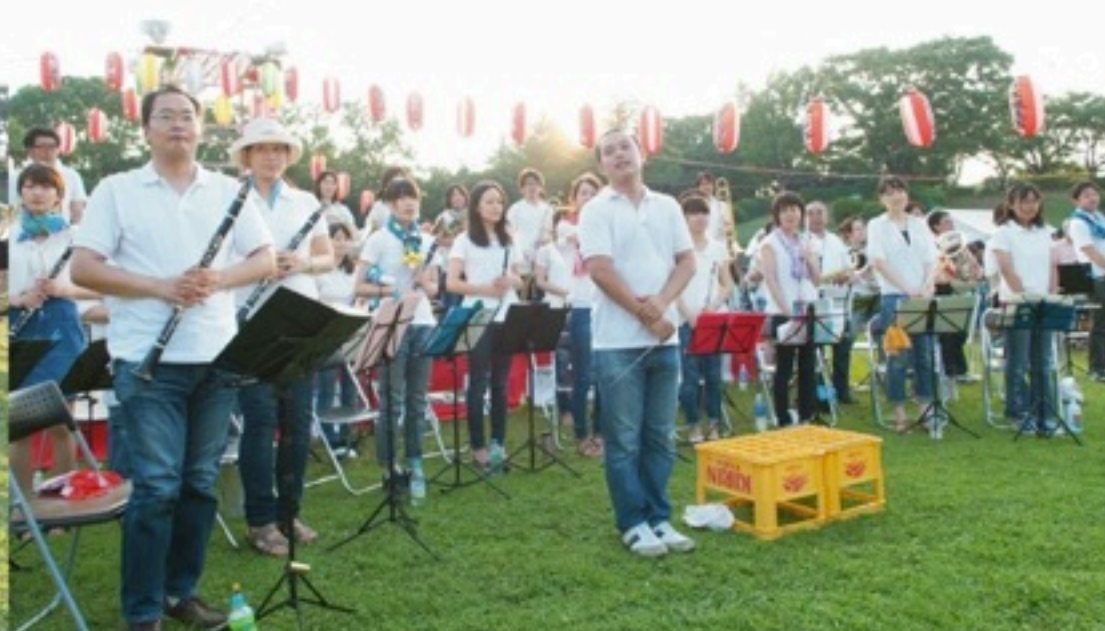
▲この夏はお祭りにも多数出演させていただきました。真夏の太陽の下、焦げそうになりながらの演奏は思い出深いです。