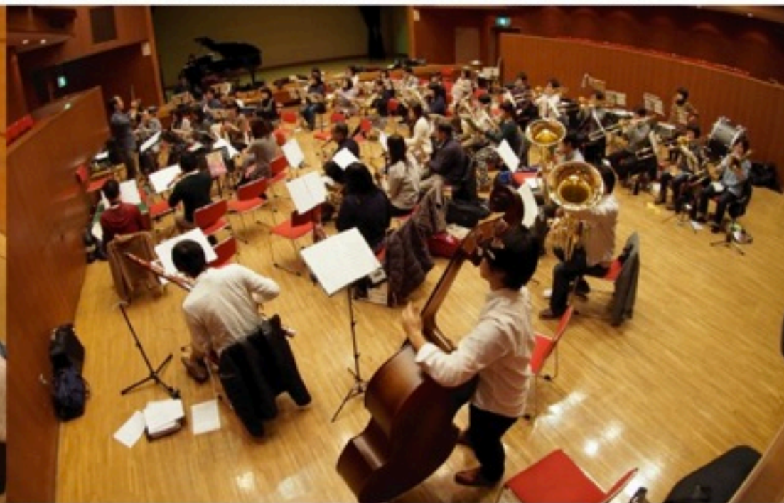
▲一年間（もしくはそれ以上）、週末のみの練習を重ねて本番に臨みます。このスタイルは基本的に創設時から変わっていません。