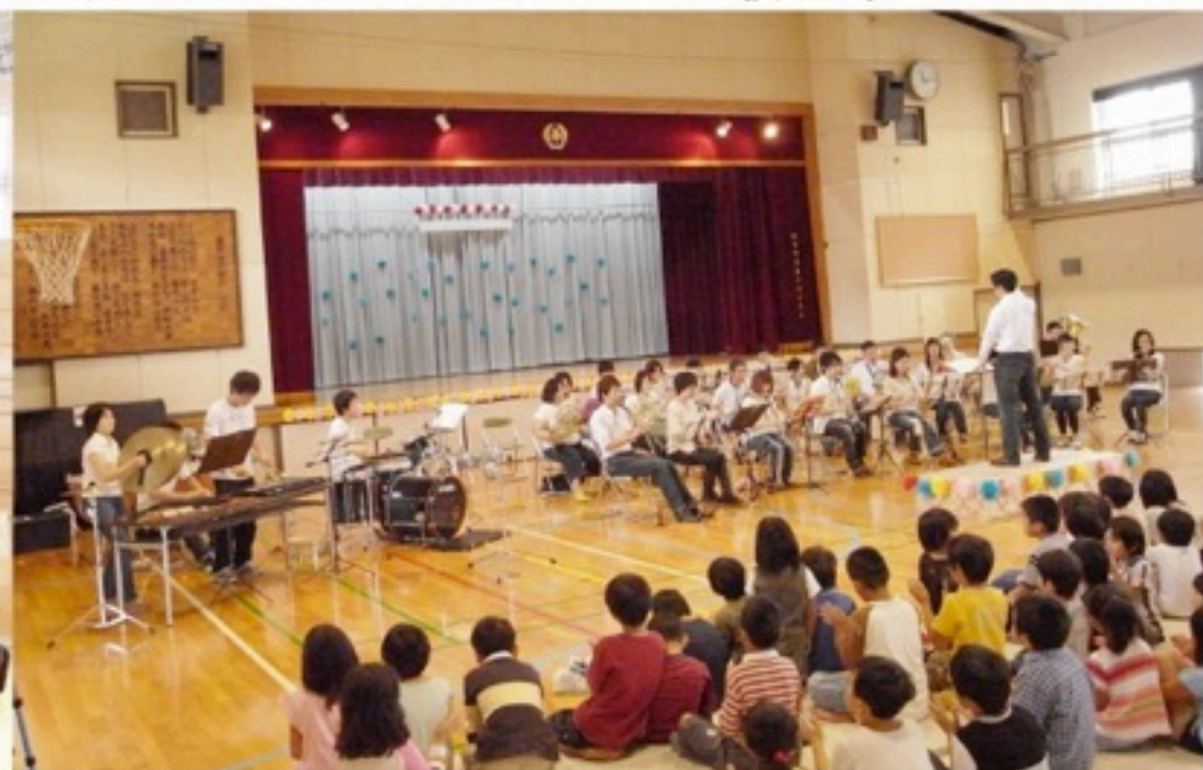
▲小学校でも演奏させていただきました。