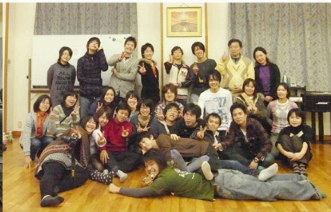
▲二年目の合宿は少し増えましたが、まだまだですね。