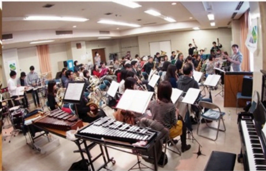
▲合宿以外にも、「一日練習」というハードな練習日が本番前には複数回あります。その名の通り、時計が一周するのです。