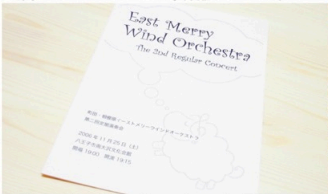
▲▼第二回定期演奏会。公式キャラ「メリーちゃん」が初登場。