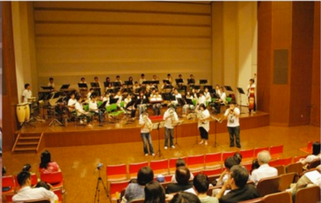
▲気まぐれサマーコンサート「夏メリはじめました。」を開催。以降、なにかと「〇〇メリ」という名前を付けがちに。