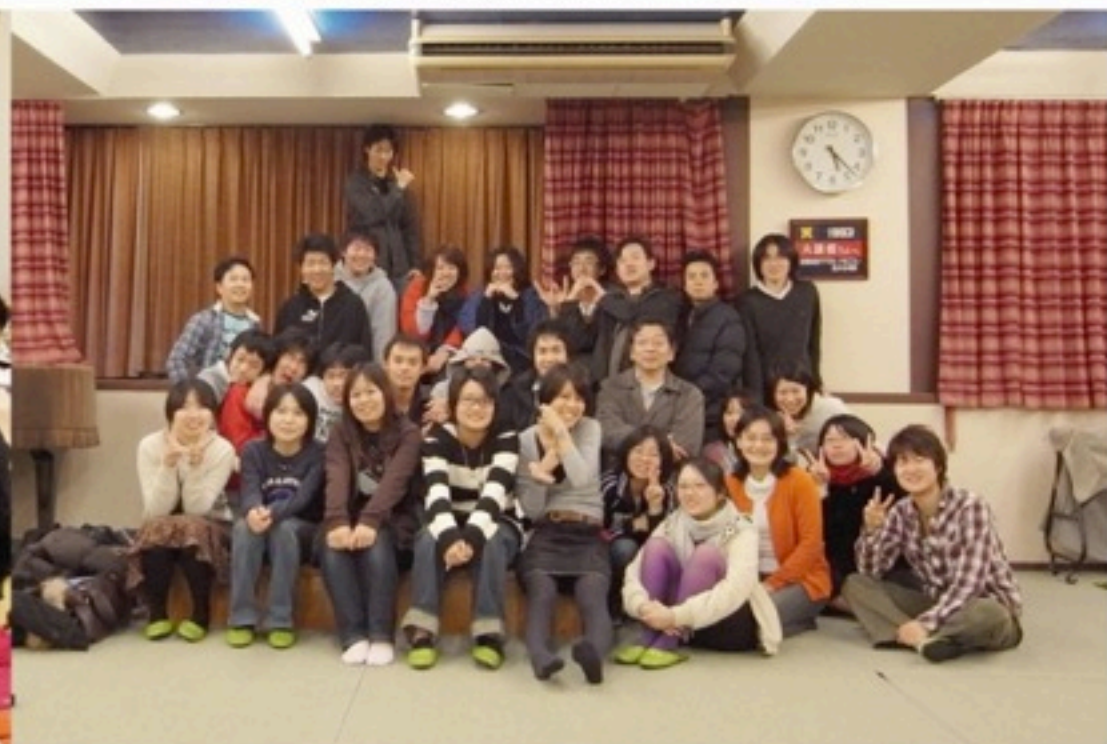
▲最初は少なかった参加人数も、これから増えていきます。