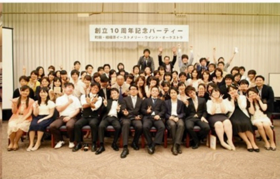
▲十周年パーティーを開催！クリエイティブ班の総力を集結した、なかなかすごい会になりました。そして新団長の発表も！